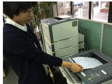
プリンター8台で環境整備